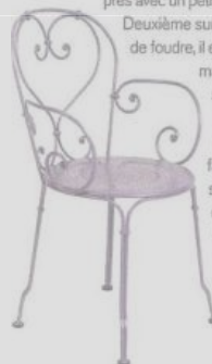
Fauteuil 1900, volutes forgées à la main, 209 € les deux.

« On raisonne à partir de l'utilité du meuble. Rien ne doit être superflu. » Pour Fermob, l'industrie se marie aussi avec le design. Cette année, Caroline Briel nous propose