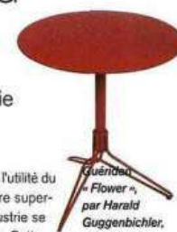
Quintessence « Flower », par Harald Guggenbichler, 235 €.