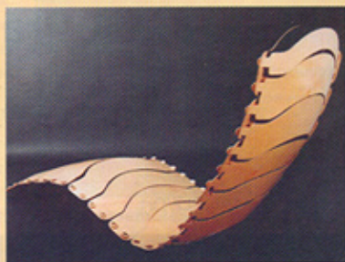
Sperrholz und verformbare Verbindungsteile ergeben den Relaxing-chair. www.hait.ac.il