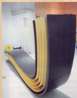
Filomena: Liegemöbel und Bibliothek in einem von Andrea Epifani, Italien.