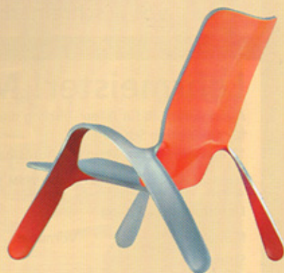
Zweischichtiger Kunststoff, verformt zu einem Stuhl. www.tricoiredesign.com