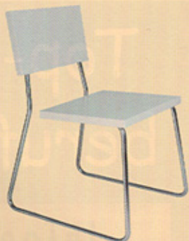
Federnde offene Form und einfachste Materialisierung von jungen Schweizern. www.biotti-kaufmann.ch

Viele Produzenten von Möbeln, Küchen, Büroeinrichtungen sowie Beleuchtungskörpern durchstreifen die spannenden Hallen des Salone Satellite in Mailand und suchen neue Ideen. Die Jungdesigner, Schulen und Jungdesignerinnen sind sich dieser Situation bewusst und verhalten sich verkaufsorientiert. (wz)