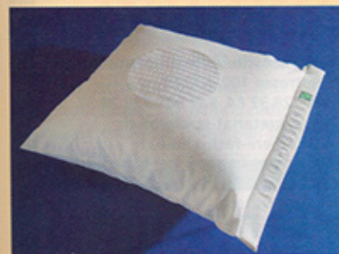
Einschlafkissen mit Musik, die sich langsam ausblendet. www.NadineMeisel.de